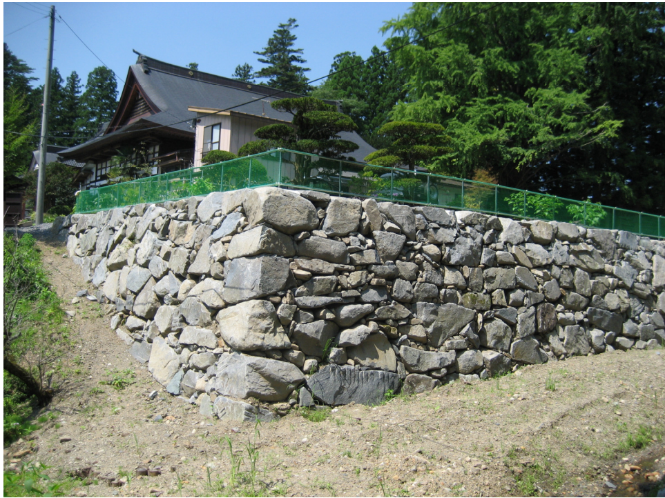
境内整備した石垣（寺東側）