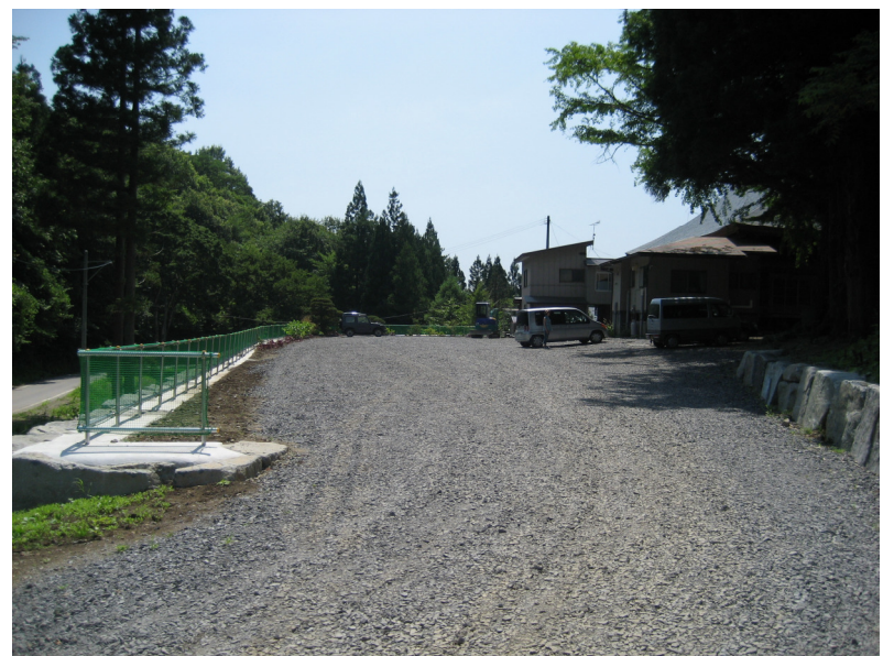
大型バスも入ることが出来るようになり、車も40台程度は駐車可能